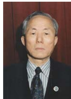
Choi Hong Hi

Choi Hong Hi blev født ind i en fremtrædende koreansk familie. Han flyttede til Japan i sin ungdom for at fremme sin uddannelse. Mens han var der, begyndte han at studere Shotokan Karate og fik angiveligt tildelt sort bælte. På tidspunktet hvor Anden Verdenskrig brød ud, blev han tvunget til tjeneste for det japanske militær. Efter Anden Verdenskrig og nederlaget til de japanske besættelsesstyrker, blev han en central figur i det nydannede koreanske militær.