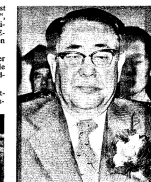
Neuer Staatschef Choi Die Diktatur löst weiter

Diktator seine bislang schwerste innenpolitische Krise durchmacht.