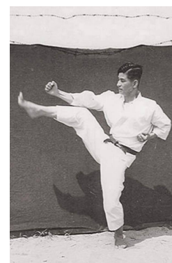
Park Chull Hee